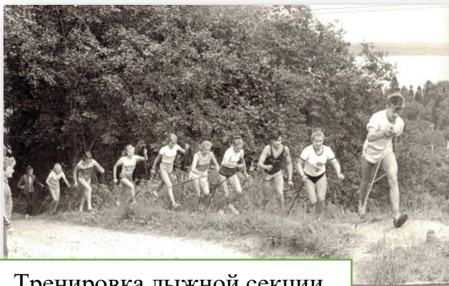
Тренировка лыжной секции